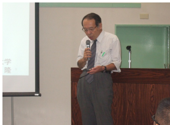
落葉から魚介類への汚染経路の解明が必要