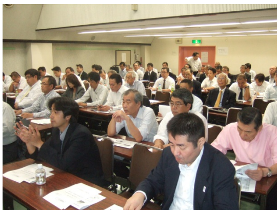
放射能汚染の安全性を確認する参加者